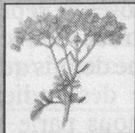
Rutine (ruta graveolens)