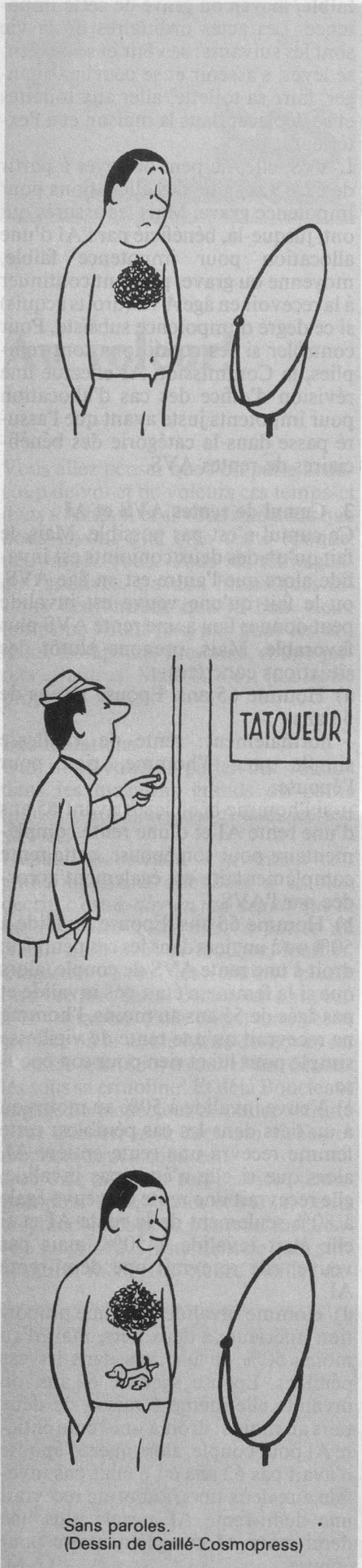
Sans paroles. (Dessin de Caillé-Cosmopress)