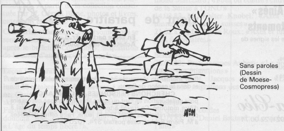
Sans paroles (Dessin de Moese- Cosmopress)