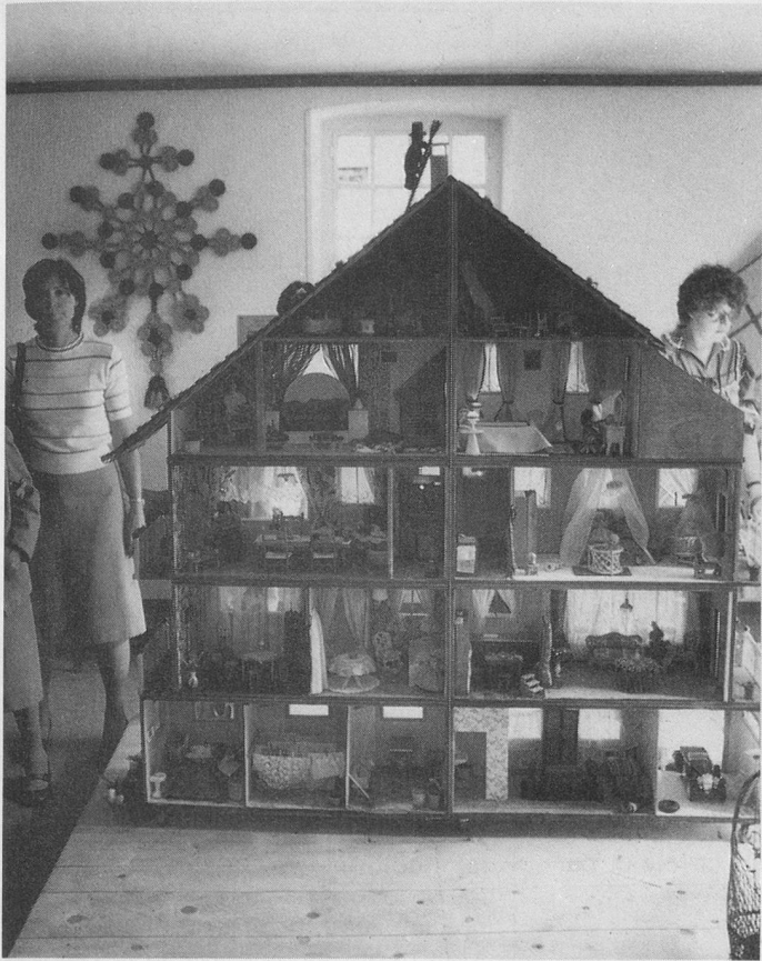
Cette maison de poupée contient tout ce qui est nécessaire au bonheur de ses habitants, jusque dans les plus petits détails. Un chef-d'œuvre.