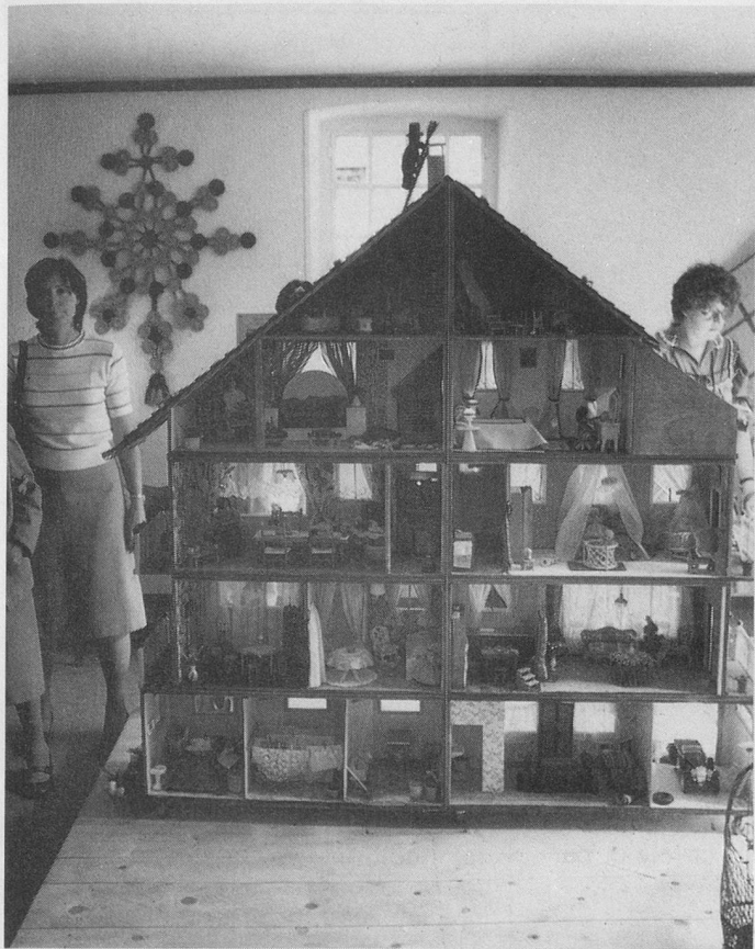
Cette maison de poupée contient tout ce qui est nécessaire au bonheur de ses habitants, jusque dans les plus petits détails. Un chef-d'œuvre.