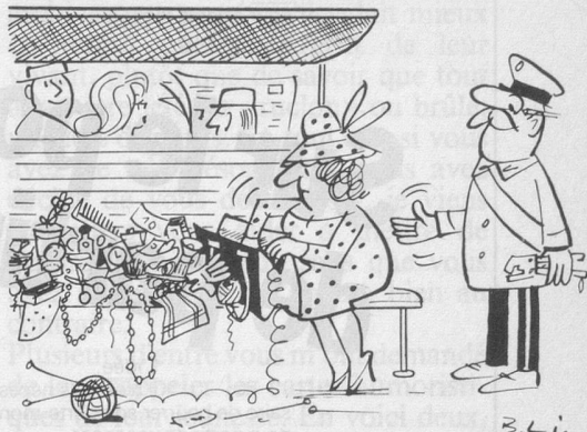
Sans paroles (Dessin de Lippisch-Cosmopress)

Prudence, patience, prévenance de la part des piétons, des conducteurs et des passagers peuvent éviter des accidents sur la route, dans le tram ou le bus.