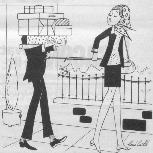
— Ne t'occupe de rien... Tu n'as qu'à suivre! (Dessin de Caillé-Cosmopress)

Prudence, patience, prévenance de la part des piétons, des conducteurs et des passagers peuvent éviter des accidents sur la route, dans le tram ou le bus.