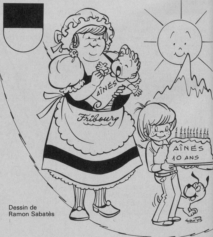
Dessin de Ramon Sabatès