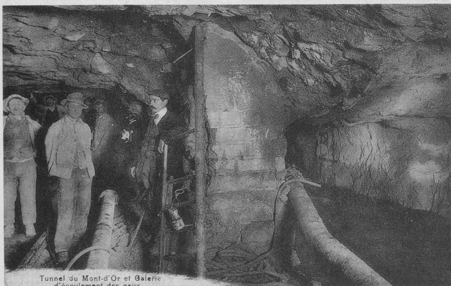
Tunnel du Mont-d'Or et Galerie d'écoulement des eaux