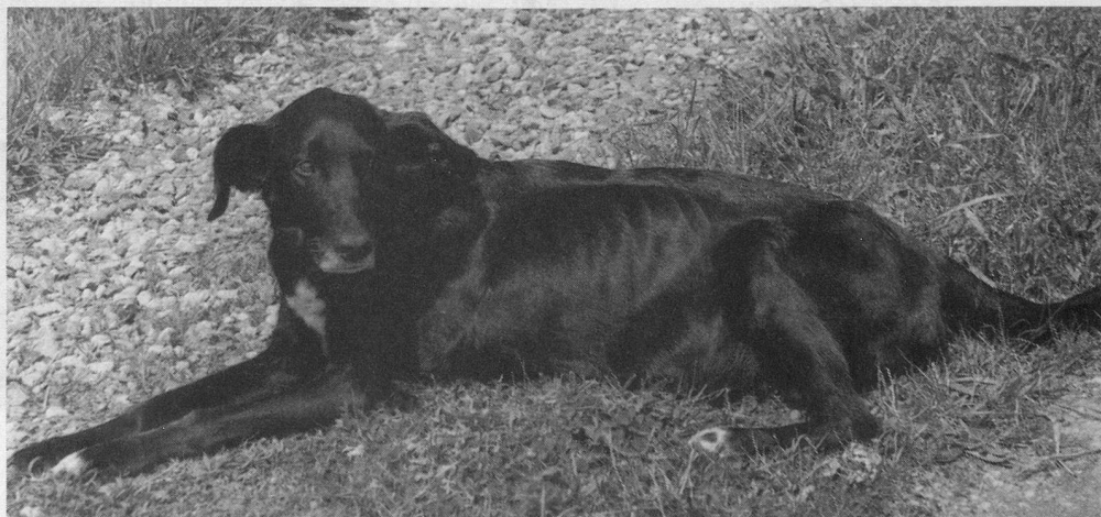
Belle, le jour de sa mort.