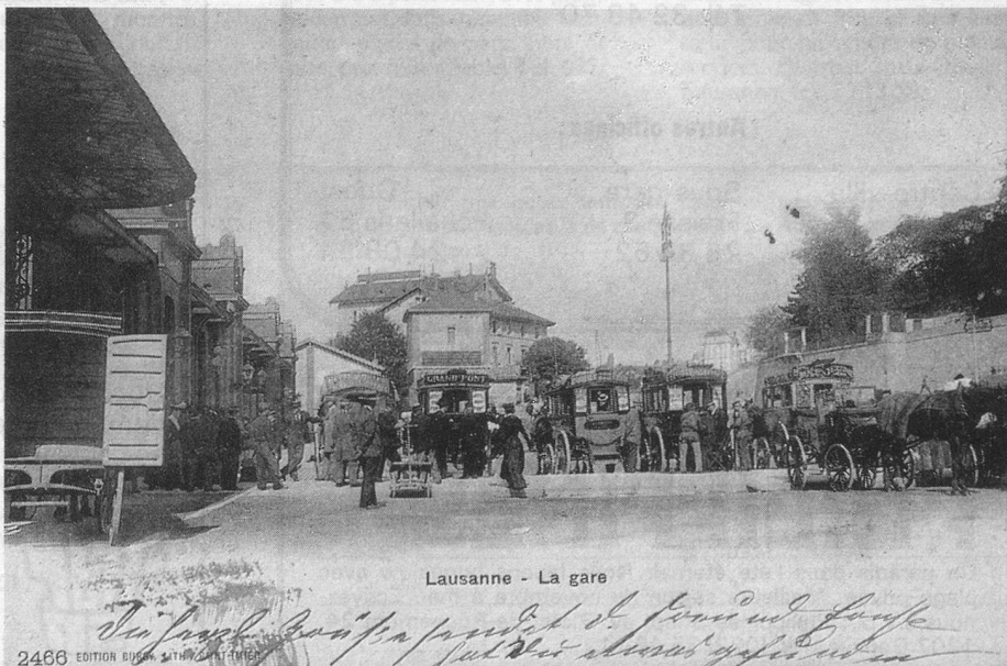
Lausanne - La gare

La place de la Gare est en effervescence. La présence des nombreuses calèches d'hôtels semble vouloir annoncer l'arrivée imminente d'un train international. Remarquez le lampadaire à gaz, à 2 globes, le seul pour toute la place... En bordure de carte, il s'agit d'un fourgon postal attendant les colis.