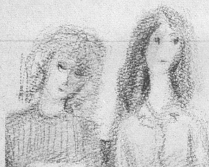
«Autodafé» Un récit vécu