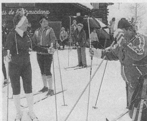
Aidez-nous à aider! La collecte de Pro Senectute