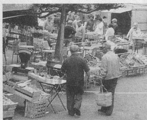
Au cœur du Roussillon: Amélie nous attend