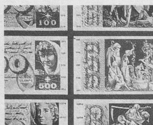
Votre argent: questions-réponses Pauvres pièces d'or...