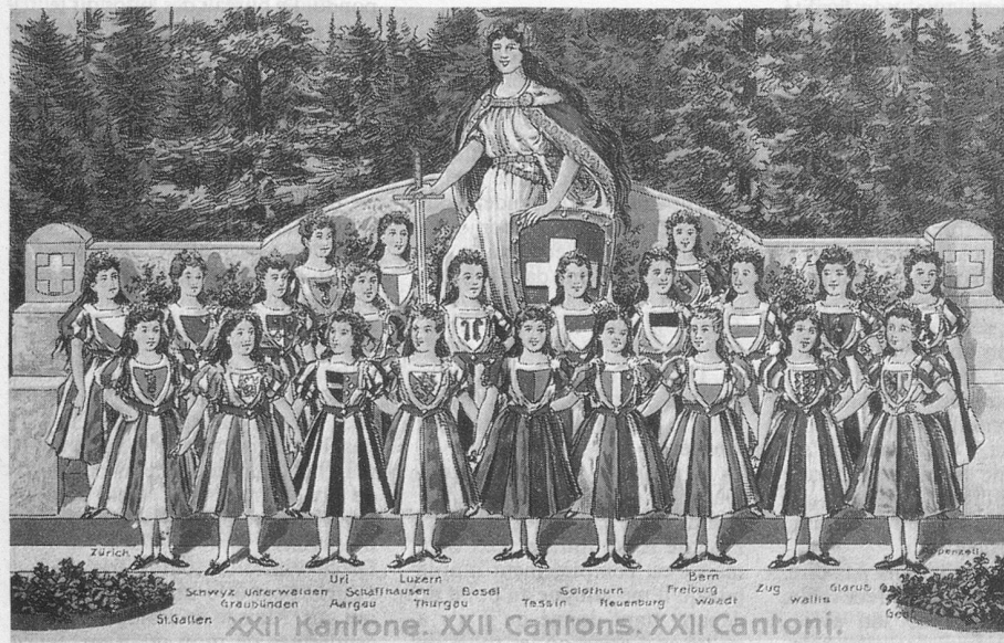
(Cartes extraites de la collection de Jean-Pierre Cuendet, 1162 Saint-Prex.)

Faut que j'use mes deux souliers (faux - queue - jus - e - mai - deux sous lié).