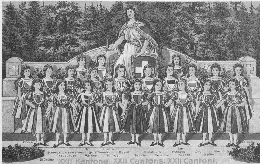
(Cartes extraites de la collection de Jean-Pierre Cuendet, 1162 Saint-Prex.)

Faut que j'use mes deux souliers (faux - queue - jus - e - mai - deux sous lié).