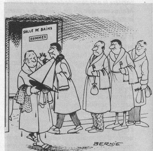
Sans paroles (Dessin de Bernie-Cosmopress)

Les personnes âgées non soumises à l'obligation d'assurance (celles qui ont un revenu plus élevé que les précitées) ne peuvent s'assurer que si elles en font la demande: