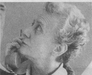
A Paris: SOS 3 e âge Visite de nos reporters