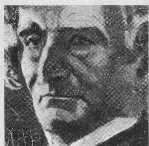
Musiciens sur la sellette Nouvelle rubrique