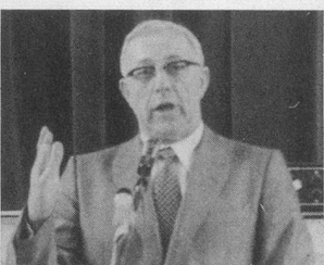
Une fédération dynamique