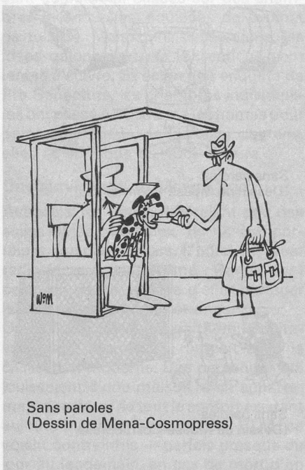
Sans paroles (Dessin de Mena-Cosmopress)