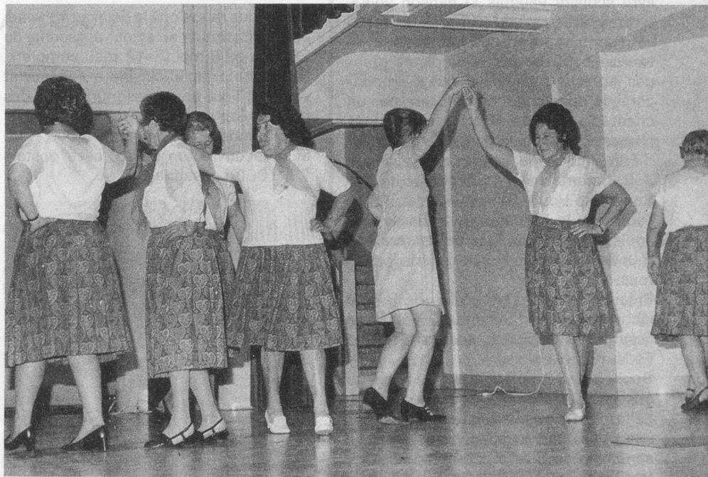
La joie et le bien-être par la gym.