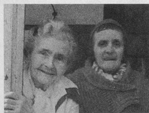
« Les Madivonnes » de Vogüé