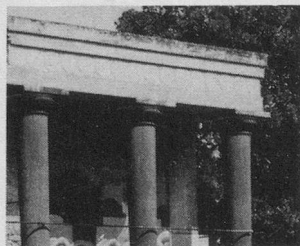
Avec « Aînés », séjour printanier en Grèce (30 avril au 11 mai 1980)