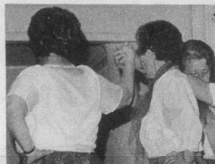
15 ans de gym 3 dans le canton de Vaud