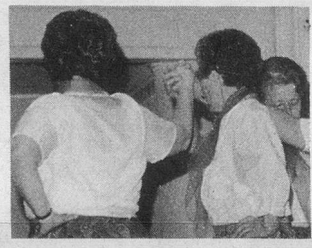
15 ans de gym 3 dans le canton de Vaud