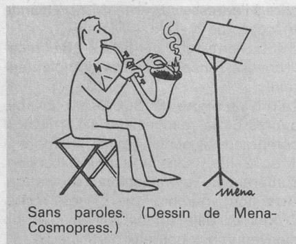
Sans paroles.