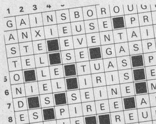
Résultats du concours de mots croisés géant