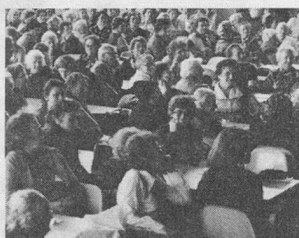
Un demi-siècle de Pro Senectute en Valais