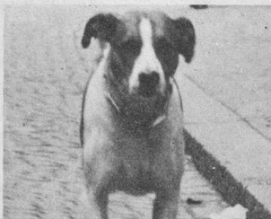
Deux histoires de chiens par Myriam Champigny