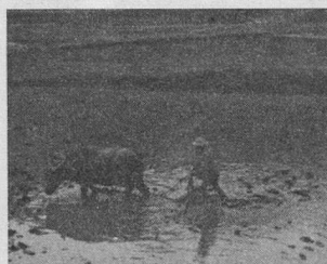
Des aînés romands découvrent la Chine