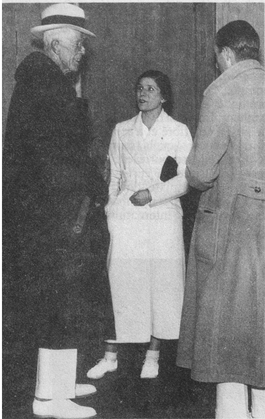
Le roi Gustav V de Suède, excellent tennisman lui-même, fut son ami et son partenaire.

elle triomphe aux Championnats d'Allemagne internationaux en double mixte et en simple. Après quoi elle remporte les Championnats internationaux d'Italie et une flopée de tour-