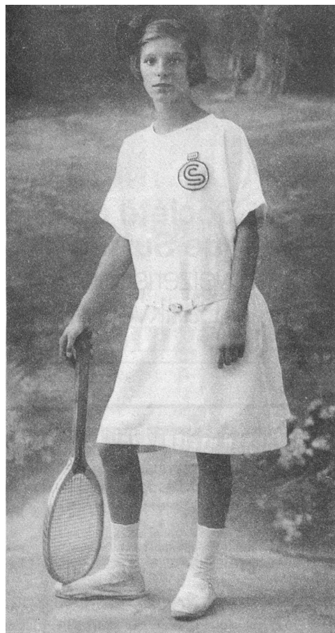
Championne de Suisse catégorie adulte à 13 ans.

che. Je ne suis jamais restée sur une défaite. Le tennis n'est pas un sport très dangereux; on peut néanmoins s'y faire mal. Sur un terrain mouillé je me suis fissuré un pied. Après avoir supporté un plâtre pendant 3 semaines, je suis partie jouer à Wimbledon. Je tenais le coup grâce aux piqûres de novocaïne.