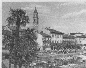
Pro Senectute: «Va et redécouvre ton pays»!