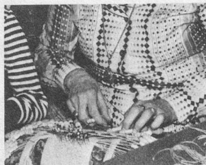
Connaissez-vous «Art et Artisanat 65»?