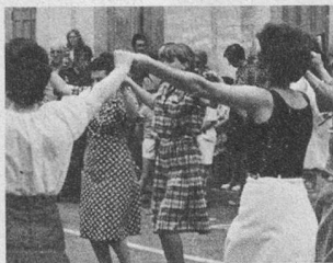
Nouveaux séjours à Amélie-les-Bains 2 ou 3 semaines