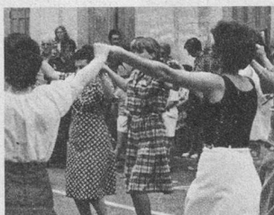
Nouveaux séjours à Amélie-les-Bains 2 ou 3 semaines