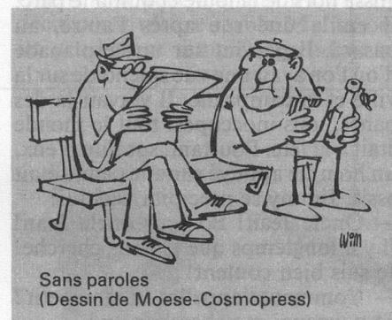
Sans paroles (Dessin de Moese-Cosmopress)