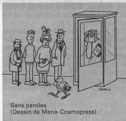
Sans paroles (Dessin de Mena-Cosmopress)

— être domiciliées dans le canton depuis le 1 er janvier 1973 au moins; — ne pas être déjà assurées pour les soins médicaux et pharmaceutiques. Les caisses pouvaient refuser l'admission des personnes qui, lors de la présentation de leur demande: — étaient hospitalisées ou dont l'hospitalisation avait pris fin depuis moins d'un mois; — avaient été hospitalisées plus de six mois durant les neuf mois qui précèdent la demande d'admission.