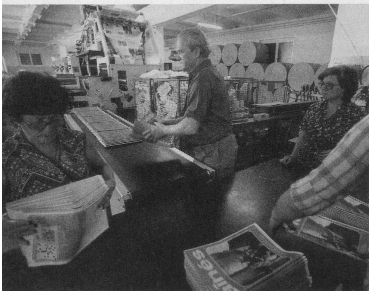
Depuis 9 ans l'impression d'«Aînés» est confiée aux Presses Centrales Lausanne S.A. Ici la rotative offset en service depuis 1977.