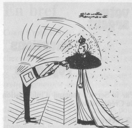
Sans paroles (Dessin de Raynaud-Cosmopress)

En ce qui concerne le calcul de la rente de vieillesse, les années de mariage comptent comme années de cotisations, si le mari était assuré.