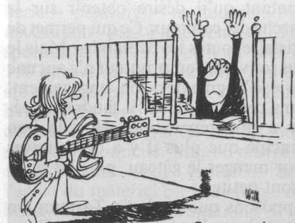
Sans paroles (Dessin de Moese-Cosmopress)