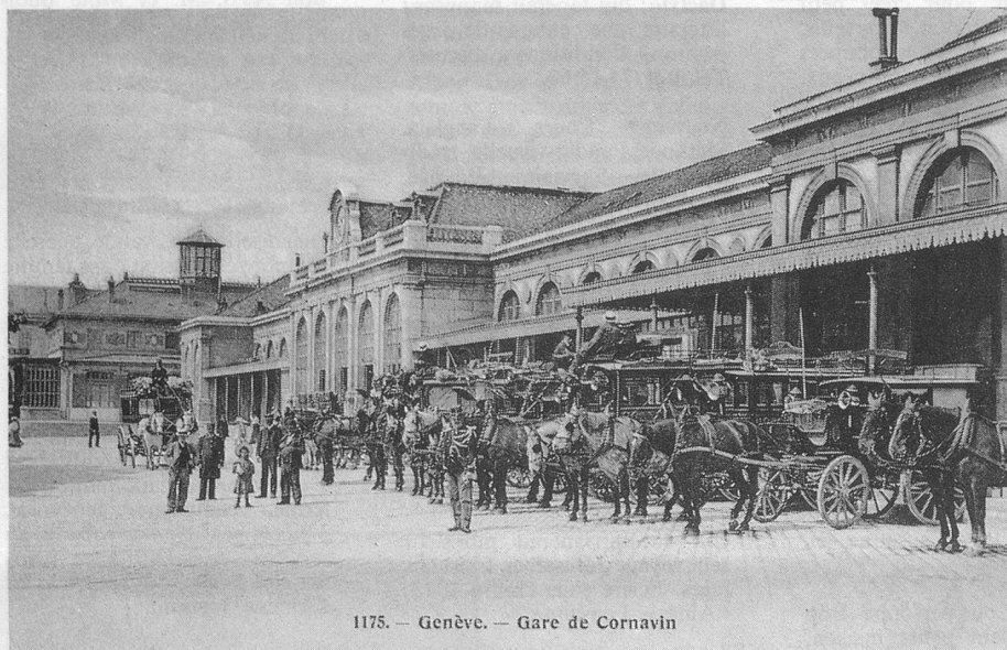
1175. — Genève. — Gare de Cornavin

Dans cette rubrique de l'ancienne carte postale, j'éprouve un vif plaisir à penser que certains d'entre vous pourront s'identifier au modèle, ou reconnaître l'époque de leur jeunesse. Il est assez étonnant de songer que, grâce à un bout de papier cartonné, il est possible de revenir 7 à 8 lustres en arrière, en rêvant de la «Belle Epoque», tout comme l'on rêve sur un prospectus actuel vantant les mérites d'un voyage aux Seychelles. Mais voilà, dans les mers du Sud, on pourra toujours aller, alors que l'ancienne carte postale est le fidèle témoin d'un passé charmant et charmeur.