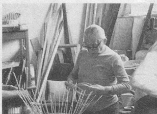
Le «Caroubier»: bilan positif