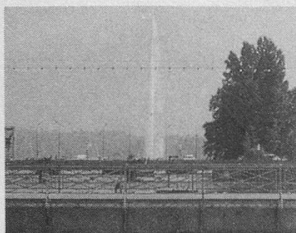
Genève sociale: une gerbe de manifestations