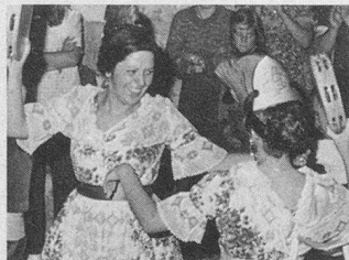
Bienvenue à Amélie-les-Bains, du 25 octobre au 8 novembre