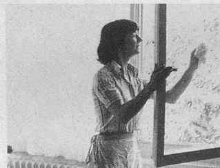
Pro Senectute: Aidez-nous à aider!