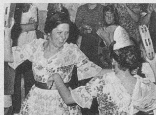
Bienvenue à Amélie-les-Bains, du 25 octobre au 8 novembre