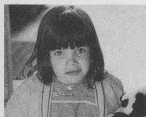
Nos filleuls vous sourient