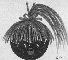
Travaux à l'aiguille et bricolages