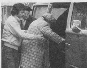
Les pages Pro Senectute. Un beau cadeau...