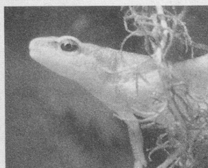
Geckos, tritons et Cie