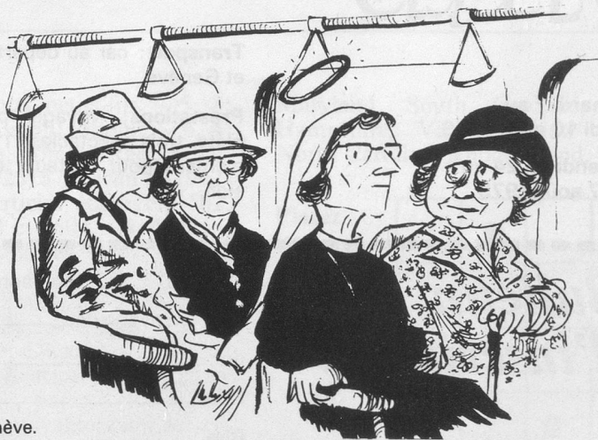
Miracle à Genève.