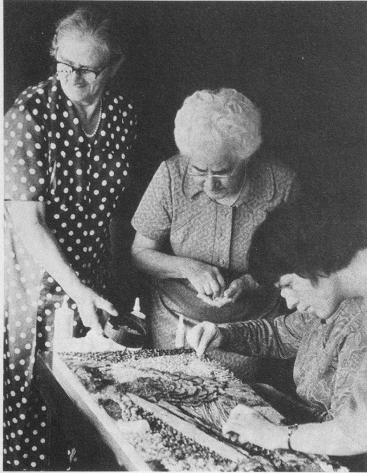
Vieillir dans la joie... (Photo G. G.).

Si nous n'avons plus de jeunesse enthousiaste, n'est-ce point un peu parce que nous ne possédons plus de vieillesse chaleureuse? A voir les vieux tirailler leur solitude, on finit par l'appréhender... Naturel, non? On chante, dans cette revue, l'espoir et la sagesse, parce que ce sont, en littérature, les semis de l'âge (Victor Hugo dixit). Encore faudrait-il avoir le courage de jeter en terre les graines —