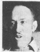
par Maurice Métral

est. Mais tout de même, avec l'âge, on devrait faire la juste part des actes et se résigner... Enfin: accepter les humeurs du temps et les brumes des années... Les jeunes n'ont donc pas — et de loin — le monopole des réactions épidermiques. Sur ce point, les aînés sont parfois plus acerbes, d'une sensibilité agressive comme si, au lieu de composer avec leur sort, ils le refusaient. Avouons que la presse n'est pas