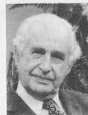
par le Professeur Eric Martin

Il faut adopter un rythme approprié à son âge. Nous en sommes bien conscients: si notre marche est trop rapide, nous sentons volontiers une petite barre sur la poitrine qui indique que notre myocarde souffre, ou une douleur dans le mollet qui témoigne d'une circulation insuffisante dans les muscles de la jambe. Libéré du poids d'une activité professionnelle absorbante, le retraité est maître de son temps. Pour une fois l'horloge ne sera plus l'arbitre de ses mouvements et de ses pensées. Il a des loisirs. Il faut en profiter et ne pas se complaire dans l'inactivité qui détériore la vieillesse comme une moisissure envahit le fruit mûr, dans la sédentarité qui atrophie cerveau et muscles.