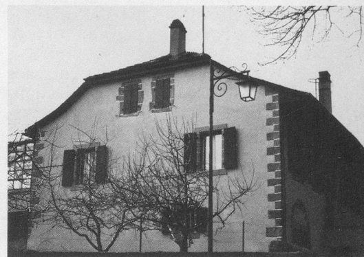
L'ancien bâtiment d'école d'Echandens.

française que je lui enseignais tous les soirs un moment. C'est elle qui faisait les achats à l'épicerie-boulangerie voisine où elle s'attardait le plus longtemps possible, profitant de cette attente pour recueillir les propos des clients dont elle nous rapportait ceux qui l'avaient frappée et quelle n'avait pas compris. Ainsi meublait-elle son vocabulaire, l'enrichissant d'expressions savoureuses, de gallicismes pittoresques dont elle nous demandait le sens exact. Elle apprenait un langage imagé qui l'amusait beaucoup, car elle savait rire de bon cœur et même rire aux larmes tout en cassant la croûte ,