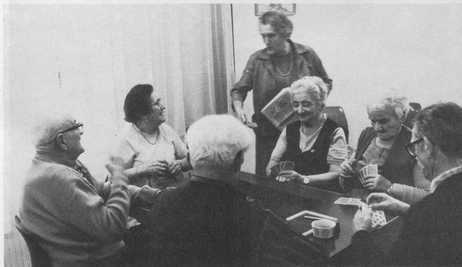
Dans les nouveaux locaux du club de Carouge, une table de champions.