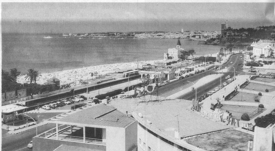
Vue partielle d'Estoril et de ses plages.