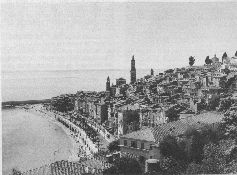
Menton, vieille ville et église Saint-Michel.

Départ de Monthey à 6 h. 30. Le car accueille au passage les voyageurs de Aigle, Montreux, Vevey, Lausanne et Genève. Papiers d'identité néces- saires.