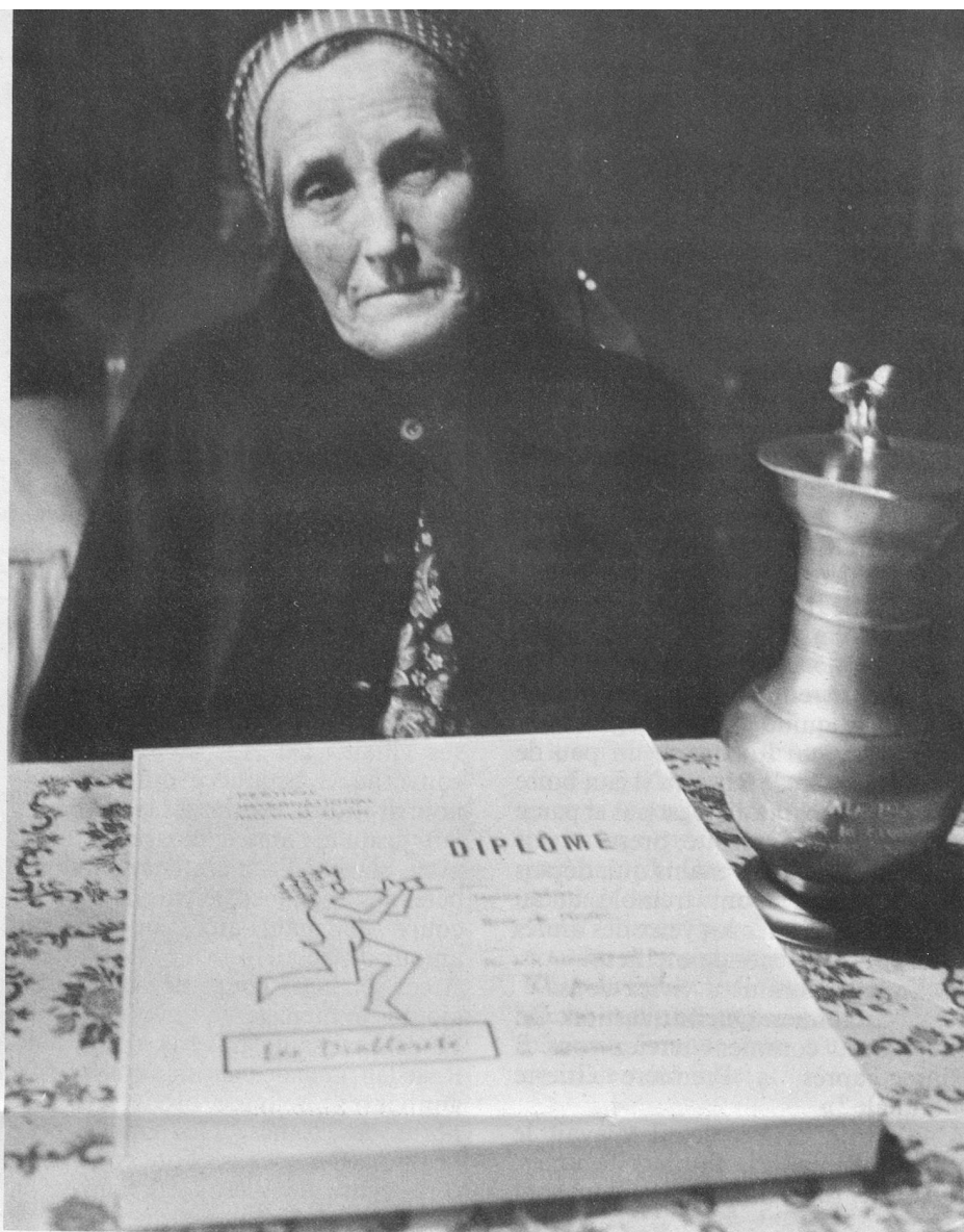
Le film a été primé au Festival des Diablerets.