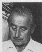
par Louis Perrochon