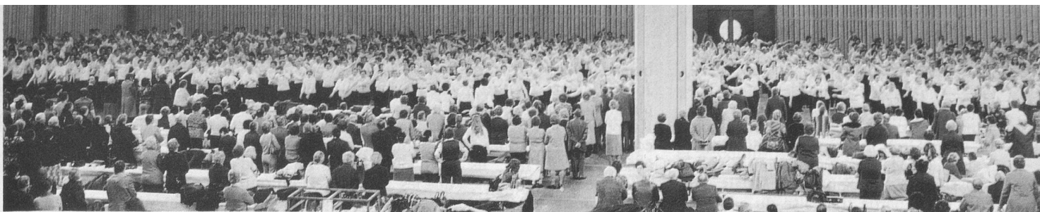
Exercice d'ensemble: près de 2000 gymnastes. Impressionnant!