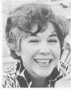
par Myriam Champigny