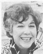
par Myriam Champigny