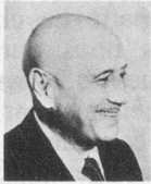
par Jean Nohain