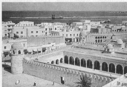
Vue générale de Sousse.

Prestations: Voyage en avion, transferts, pension complète en hôtel au bord de la mer.