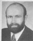
par Guy Métrailler

correspond au nombre d'années écoulées depuis le 1 er janvier de l'année au cours de laquelle l'assuré a atteint sa 21 e année (ou dès 1948, s'il avait déjà 21 ans cette année-là) jusqu'au 31 décembre de l'année précédant le droit à la rente.