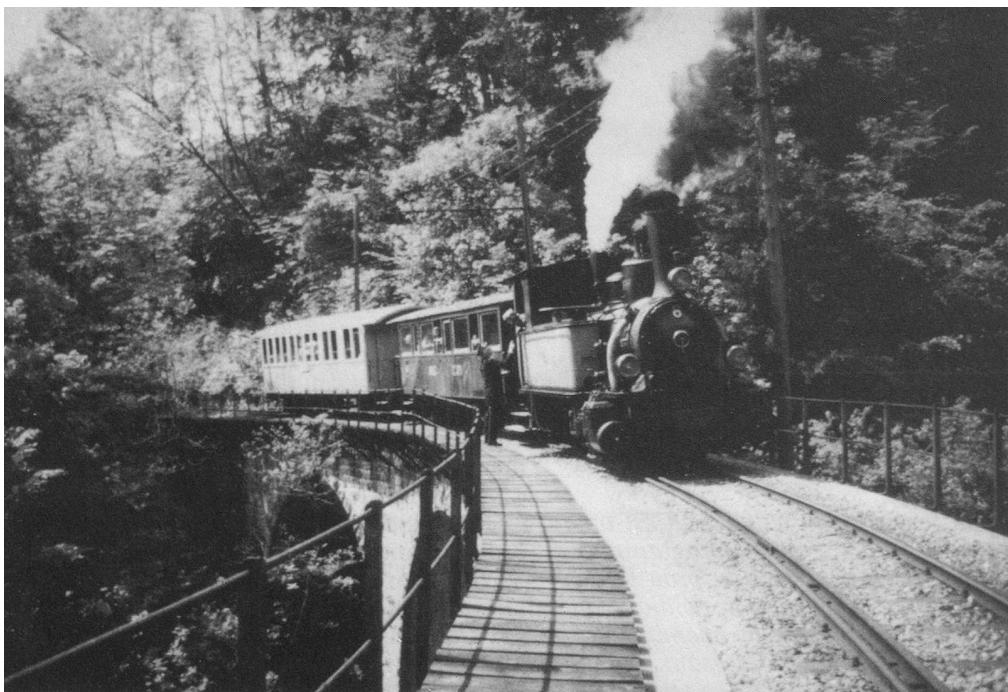
Blonay-Chamby, le petit train de la joie.