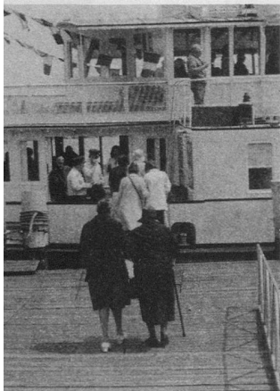
A 12 h. 30, premières arrivées. Deux heures plus tard les vapeurs prendront le large.

Ces vérités-là, trois charmantes dames nous les ont confirmées, heureuses de pouvoir, par le truchement du journal «Aînés», dire leur joie et leur gratitude à la Fondation.