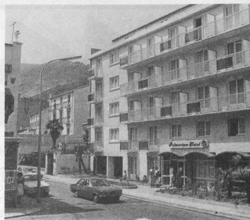
Inauguré le 7 juillet, l'Hôtel Palmarium 2 étoiles.

Alors, amis lecteurs, si ce séjour à Amélie (tourisme ou cure) vous intéresse, remplissez le coupon ci-dessous et envoyez-le à «Aînés», case postale 2633, 1002 Lausanne (tél. 021/22 34 29) . Vu le nombre d'inscriptions déjà enregistrées, il est certain que ces prochaines vacances en Rousillon, à 27 km de la Méditerranée, remporteront un nouveau succès éclatant. Précisons que nos voyages à Amélie bénéficient d'un accompagnement aussi compétent que sympathique.