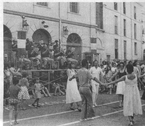
Les jours de fête, à Amélie...

Les frais de cure sont à payer sur place.