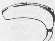
Avec microphone hyper-directionnel