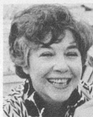
par Myriam Champigny