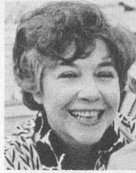
par Myriam Champigny