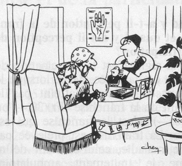
— On va se marier. Parlez-moi de son passé, je me charge de son avenir! (Dessin de Chen - Cosmopress)