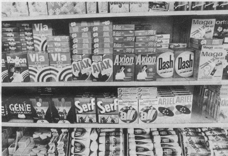
L'équipe d'«A bon entendeur»: des virtuoses de la lecture à travers les emballages.