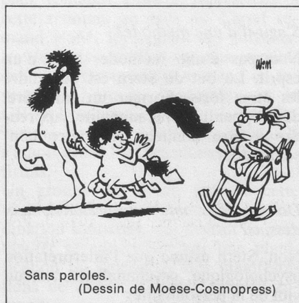
Sans paroles. (Dessin de Moese-Cosmopress)

Quant à la plainte pour dénonciation calomnieuse dont vous menace votre adversaire, pour qu'elle aboutisse, il faudrait qu'il démontre que vous n'êtes pas le propriétaire du tricycle.