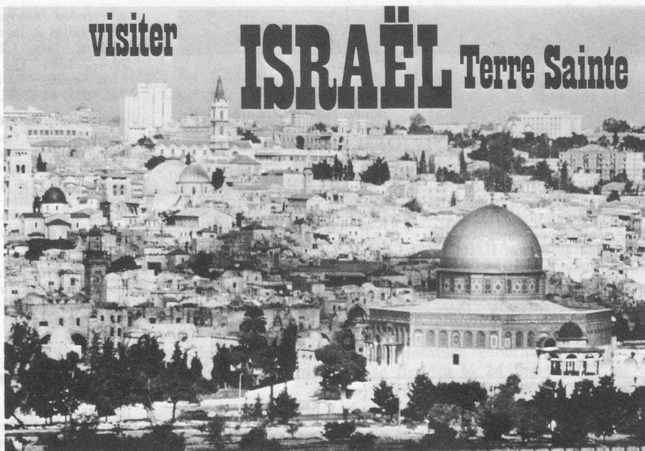
▲ Jérusalem. Au premier plan, la mosquée d'Omar.